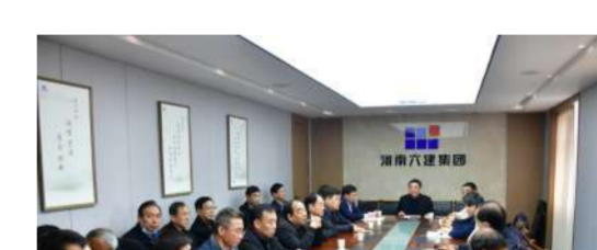
3月8日,集团公司召开2022年度股东会。