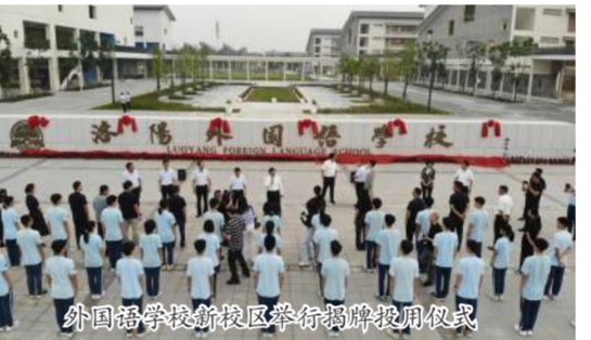
外国语学校新校区举行揭牌投用仪式