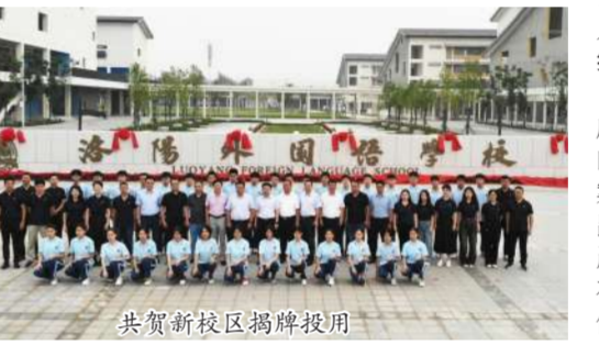
共贺新校区揭牌投用

9月1日，由集团公司承建的洛阳外国语学校新校区揭牌投用，市长徐衣显、常务副市长张玉杰、副市长李新红等领导以及市直有关委、局、区领导和相关人员出席活动。