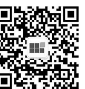
河南六建微信公众号(扫码关注)