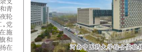
河南中医药大学综合实验楼

近日，河南省工程建设协会公布了2022-2023年度河南省工程建设优质工程获奖名单，集团公司承建的多个工程项目榜上有名。