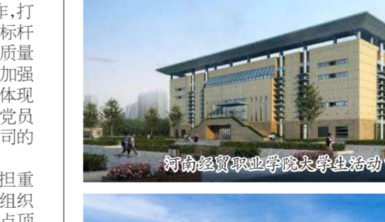
河南经贸职业学院大学生活动中心