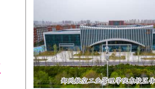
郑州航空工业管理学院东校区体育馆